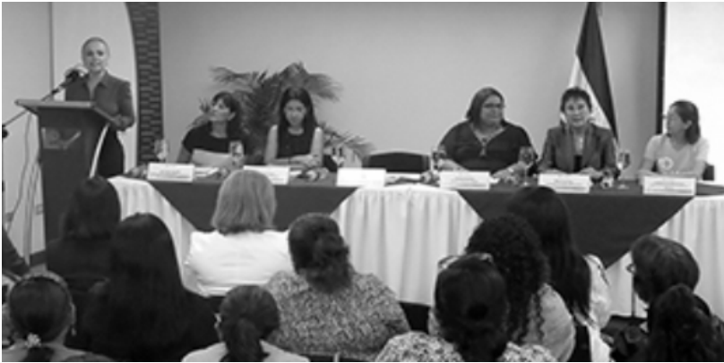
Foto N° 2 "Rendición de Cuentas 2014-2015 INSDEMU, El Salvador, 2014"

Fuente: Embajada de Chile en El Salvador.